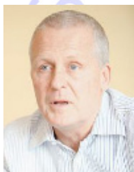
ALAIN CARDON - MCC.

Master Certified Coach por el ICF - International Coach Federation y una de las figuras de mayor reconocimiento internacional y referencia en materia de Coaching Sistémico y Organizacional; autor de numerosas publicaciones y libros, entre estos destacamos el aclamado libro "Le Coaching d'Équipes". Alain Cardon inspira y dirige a Metasystème, organización totalmente orientada a resultados, red de coaching de equipo y organizacional radicalmente dedicada a incrementar el éxito medible a través del avance de las estrategias sistémicas. Alain Cardon forma y supervisa coaches en Francia, Bélgica, Rumanía y España.